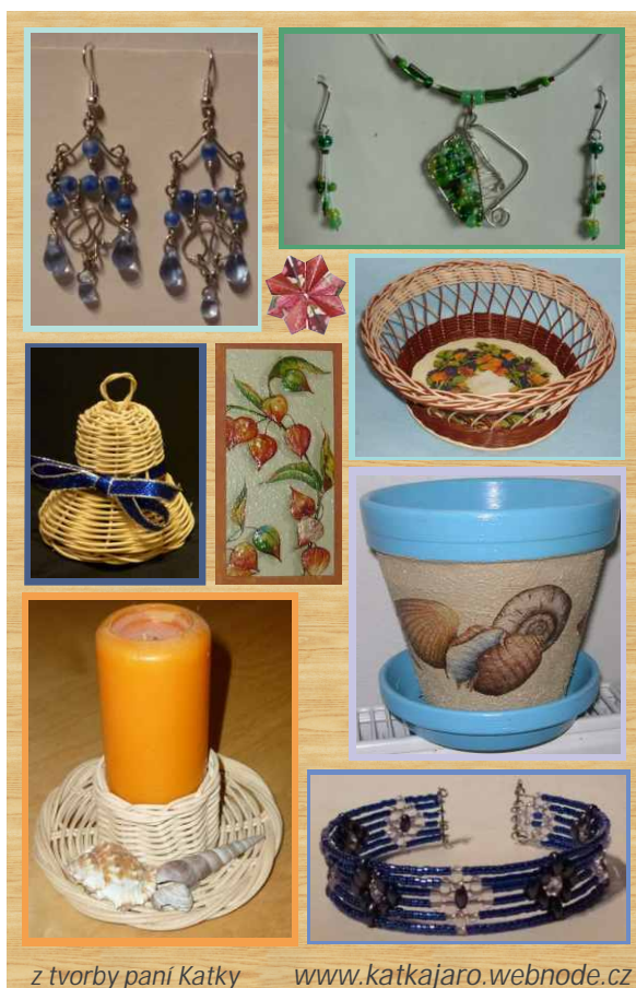
z tvorby paní Katky www.katkajaro.webnode.cz

Avšak nejvíc jsem snila o tom, že bych jednou vyráb la šperky. V bec jsem ale netušila, jak se to d lá. Dívala jsem se na stránky jedné paní a byla jsem smutná, že nic takového neumím. Pak nastoupila dcera do školy a hned záhy jsem zjistila, že tam probíhají kurzy korálkování pro maminky. P íhlásila jsem se. První hodinu jsem si ekle základní informace a nau ily se d lat o ka