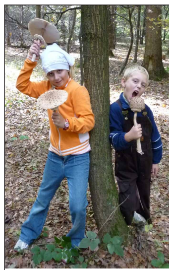
vít zná fotografie