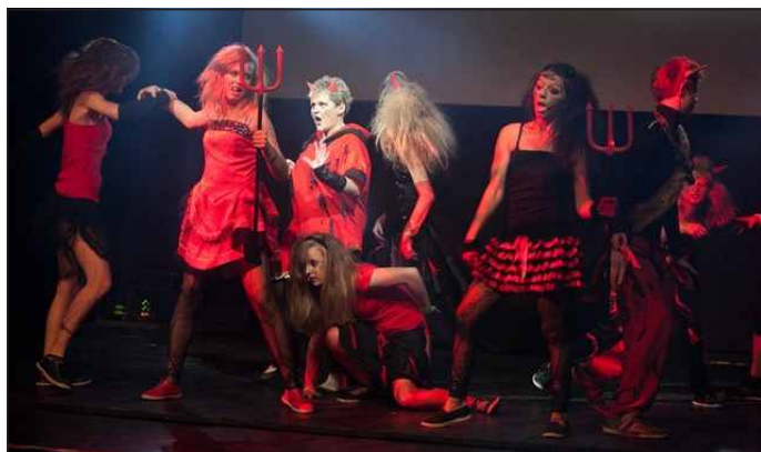
bronz v kategorii muzikál

DD z Frýdku-Místku na tuto akci přizval i sdružení MYGRA-CZ, jejich zástupci přišli „naše děti“ v jejich soutěžení rádi podpořit. Na vlastní kůži jsme tak měli možnost zažít neskutečnou atmosféru, obrovskou motivaci a nadšení dětí, které celý rok pilně trénují, aby dříve v taneční soutěži proměnily na medaile v soutěžích.