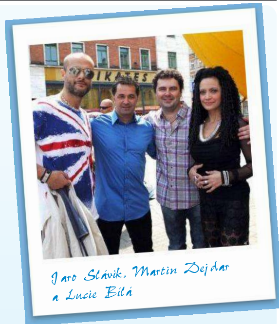
Jaro Slávik, Martin Dejdar a Lucie Bílá