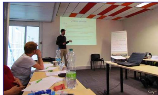
seminář v budově IBC Building v Karlíně

Představení studia 31. října 2012 bylo velkolepé, výborně zorganizované a proběhlo v Poslanecké sněmovně, protože záštitu poskytl Zdravotní výbor PSP ČR. Tato perfektně připravená prezentace velmi vzbudila velké očekávání a naději, že snad nepjde o pohledku ztraceného času a dovolené, kterou jsem si musela v pracovních dnech vybírat.