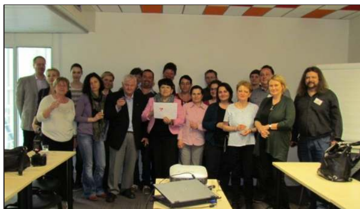
účastníci Akademie patientských organizací

Nemén důležitým přínosem bylo navázání kontaktů s ostatními patientskými organizacemi, sdílení stejného problému a získání nových informací z praxe jednotlivých sdružení.