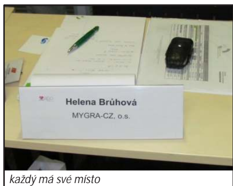
každý má své místo

Celé APO se účastnilo kolem dvaceti patientských organizací, tedy celkem 40 lidí, rozdělených do dvou pracovních skupin po dvaceti osobách. V listopadu 2012 se rozjel maraton zajímavých přednášek, vedených zkušenými lektory a rozbehlo se vlastní studium.