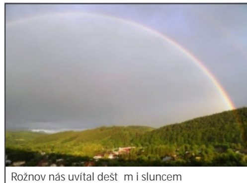
Rožnov nás uvítal dešt m i sluncem