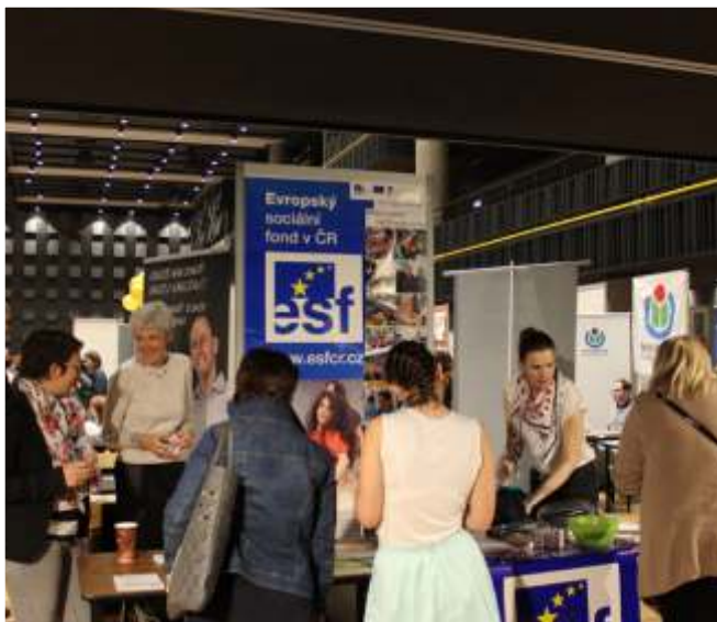
Stánek MPSV na NGO Marketu 2015

I letos najdete mezi vystavovateli NGO Marketu stánek Ministerstva práce a sociálních věcí, řídicího orgánu Operačního programu Zaměstnanost. Dozvíte se tam, jaké jsou možnosti podpory z tohoto programu, jak postupovat, když nosíte v hlavě nápad na nějaký projekt a spoustu dalších užitečných tipů. Pro ty zkušenější, kteří se ve světě dotací pohybují již nějakou dobu, jsou určeny informace o aktuálně vyhlášených výzvách , jejich alokacích či oprávněných žadatelích. A ti, kteří chtějí přispět ke zrovnoprávnění žen a mužů na trhu práce, mohou zavítat na náš seminář věnovaný této problematice.